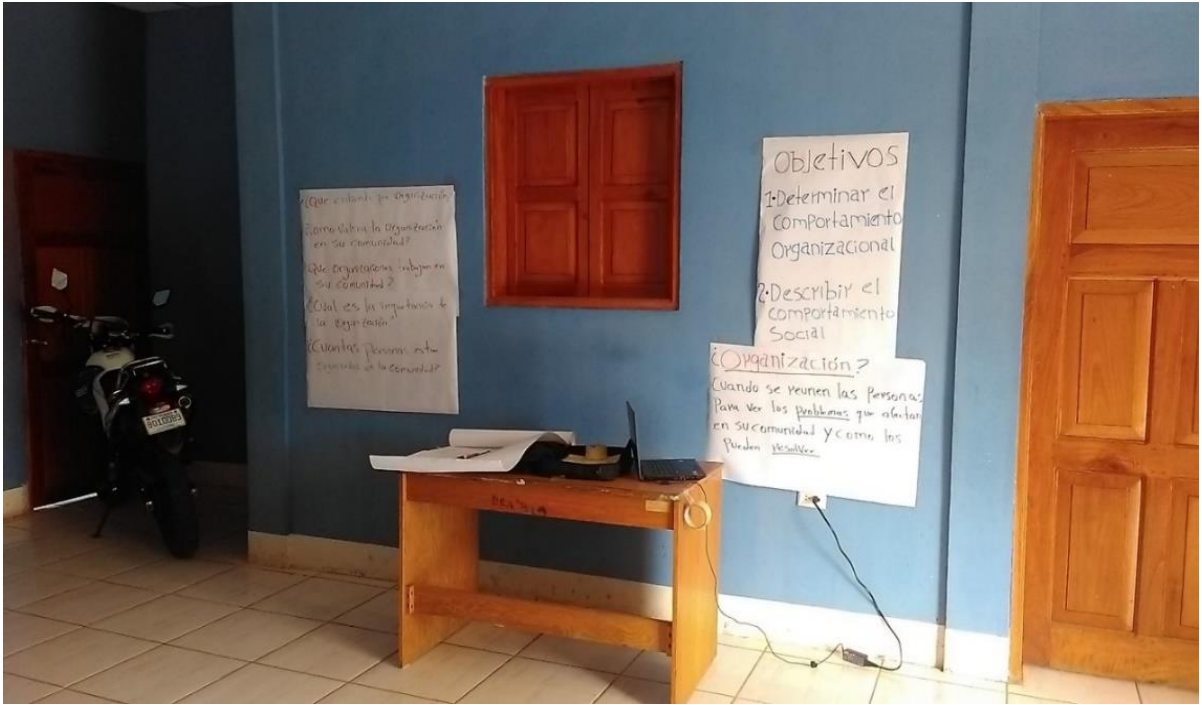
Materiales didácticos utilizados en grupos focales.