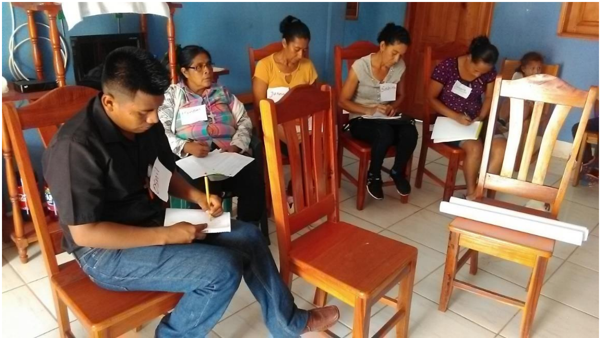
Actores locales en una de las sesiones.