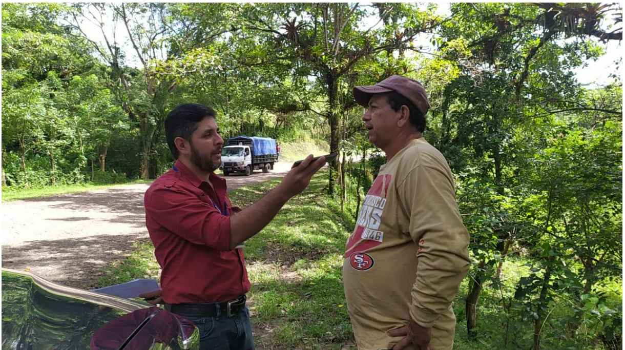
Entrevista al Sr. Benicio Robleto, líder político en la localidad