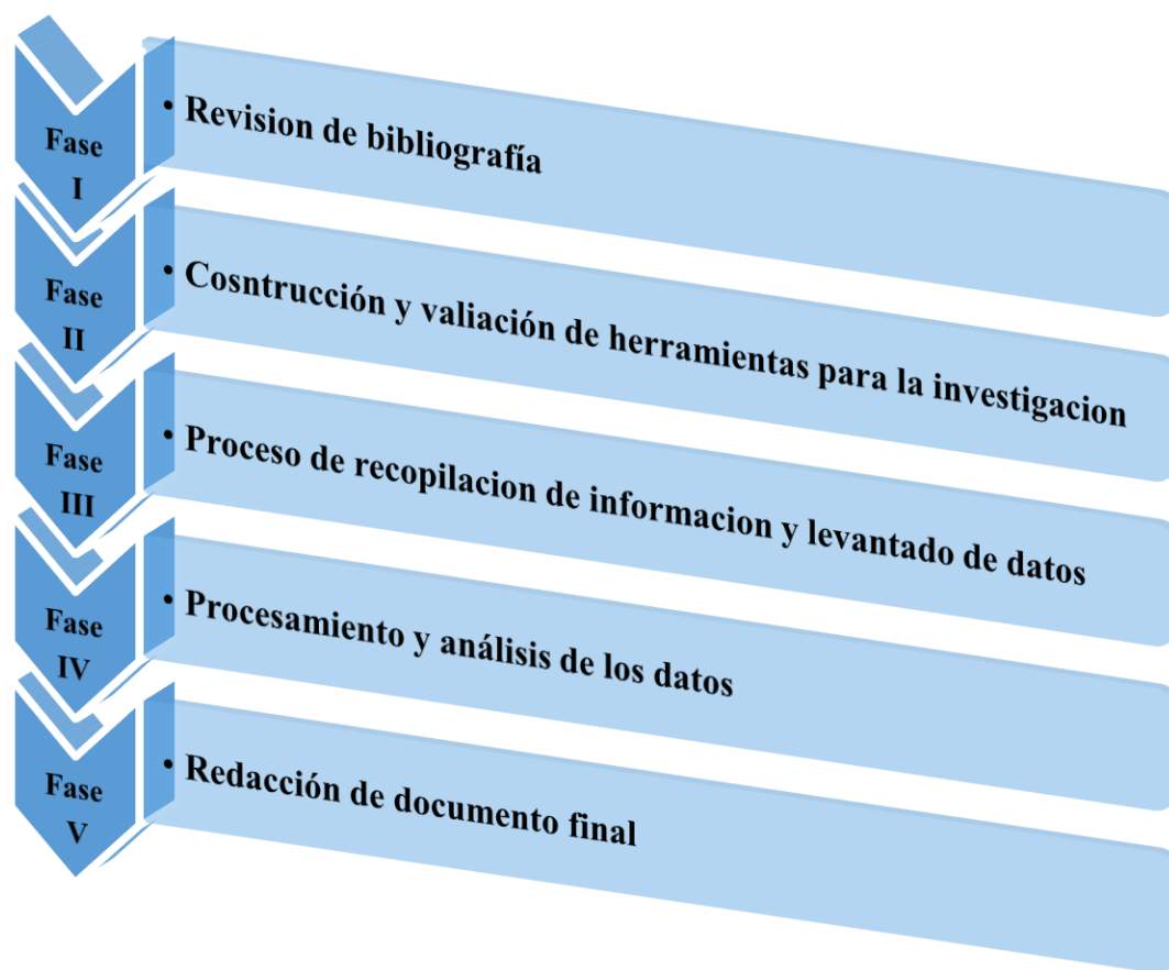
Figura 2. Esquema metodológico de las fases de la investigación.

El estudio se organizó por fases que iniciaron con el desarrollo de la propuesta y elaboración del protocolo para la investigación, pasando el trabajo de campo el cual consistió en un estudio en la comarca, hasta la presentación del presente informe. La investigación tuvo un abordaje cualitativo, de carácter descriptivo y analítico. Se encontraron hallazgos relevantes a partir de lo que narró la gente al momento de hacer preguntas y dialogar sobre sus percepciones, valoraciones y experiencias. Para contextualizar los hallazgos se complementó la información empírica mediante el análisis de fuentes secundarias.