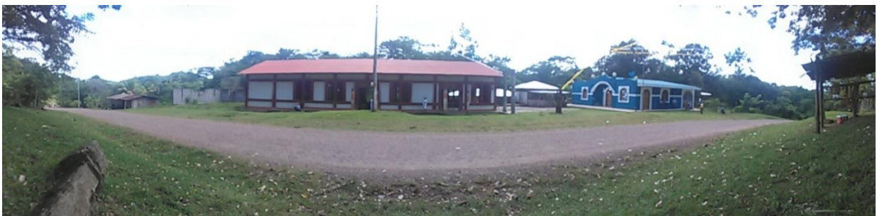
Imagen panorámica del centro de la comunidad donde se observa la iglesia “Santa Martha” (Izquierda), el comedor de ancianos (Centro) y la casa cural, el punto de reunión más frecuente en la localidad.