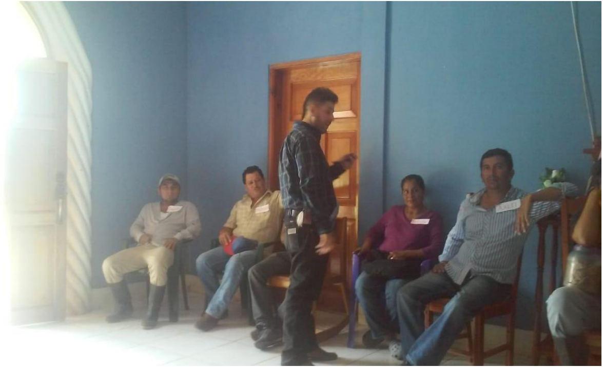
Moderador realizando explicación.