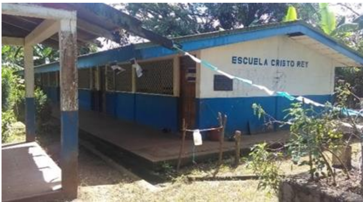
Figura 5. Centro escolar “Cristo Rey” de la comarca Masigüito.

(A5) LR: “Algunas aulas ya tienen pizarra acrílica, como se decía las puertas están dañadas la malla también y entonces no hay una seguridad ahí en el centro”.