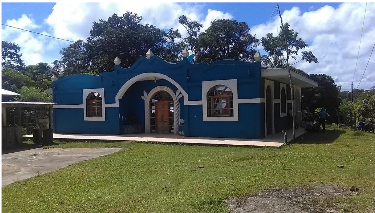
Casa cural de la Iglesia “Santa Martha” en la comarca Masigüito, punto estratégico de reunión donde se desarrollaron las sesiones de grupos focales.