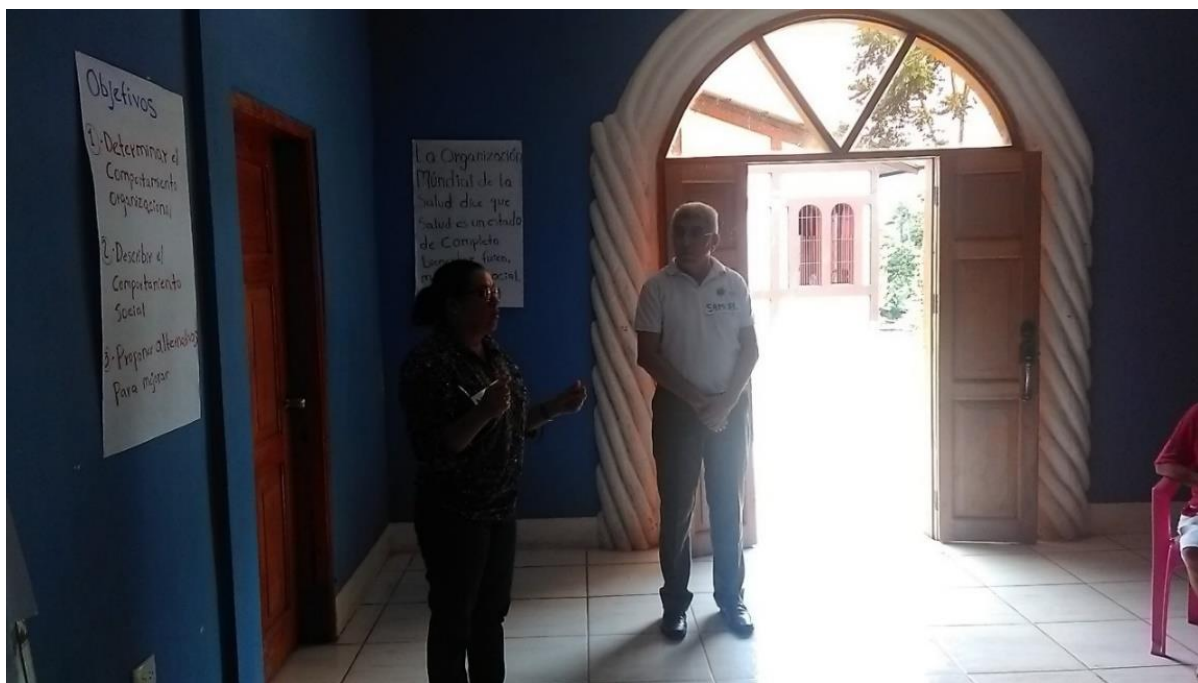
Equipo de investigación realizando presentación.