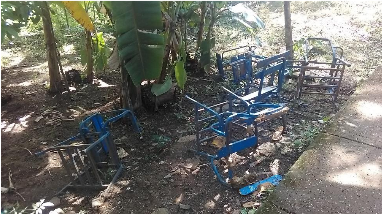
Figura 6. Pupitres.

De acuerdo a las respuestas que brindaron, existe un deterioro de la infraestructura del centro escolar ya que describieron parte de ésta en malas condiciones porque falta reparar el techo, la malla, persianas de las ventanas y puertas entre otras. No obstante, se encontró que tanto el edificio como el terreno donde está ubicada ésta, cumplían con las normativas establecidas por el Ministerio De Educación (MINED), (2008) en relación a las dimensiones, tamaños de las aulas, requerimientos mínimos de acceso, pasillos, señalamientos con información del centro, capacidad de alumnos por salón, sin embargo los actores por desconocimiento expresaron que las aulas de la escuela eran pequeñas y que según ellos no cumplía con las exigencias que debe tener una escuela rural y por lo tanto la consideraron pequeña.