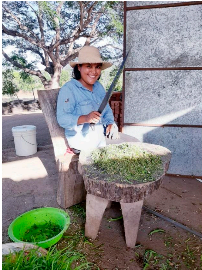
Picado manual del FVH

La frecuencia de suministro debe ser preferiblemente 3 veces al día mezclado con el concentrado y evitar la fermentación del forraje y por ende el desperdicio del mismo por rechazo. También, puede suministrarse por separado del concentrado, priorizando el forraje de primero y en dos momentos para garantizar su consumo.