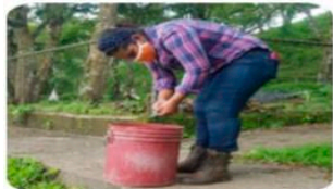
Desinfección con NaClO