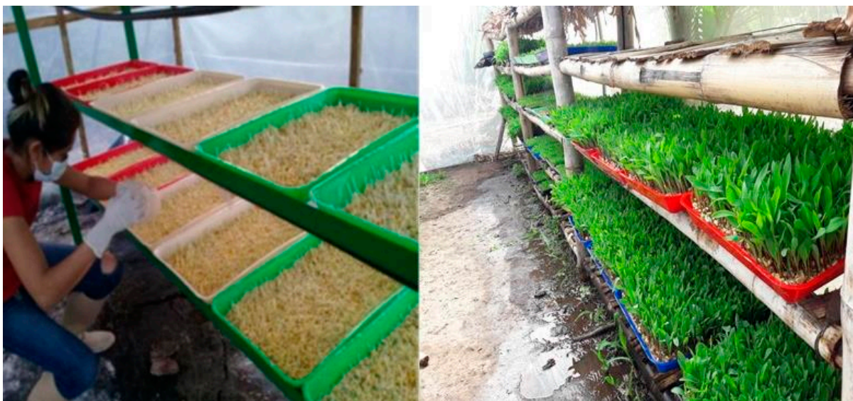
Estantería metálica y de bambú

Para la colocación de las bandejas se pueden utilizar diversas estrategias, pero lo importante es proteger el cultivo, en la mayor medida posible, de factores externos. En dependencia de la economía del productor, se pueden innovar las estanterías de acuerdo a la cantidad de forraje que se requiera producir. Estas pueden ser construidas de metal, madera, bambú o cualquier material disponible en la unidad de producción. A la hora de construirlo debe garantizar que las bandejas queden con un desnivel, a lo largo, de al menos 2% y asegurar pequeños orificios de salida a las bandejas para propiciar el drenaje.