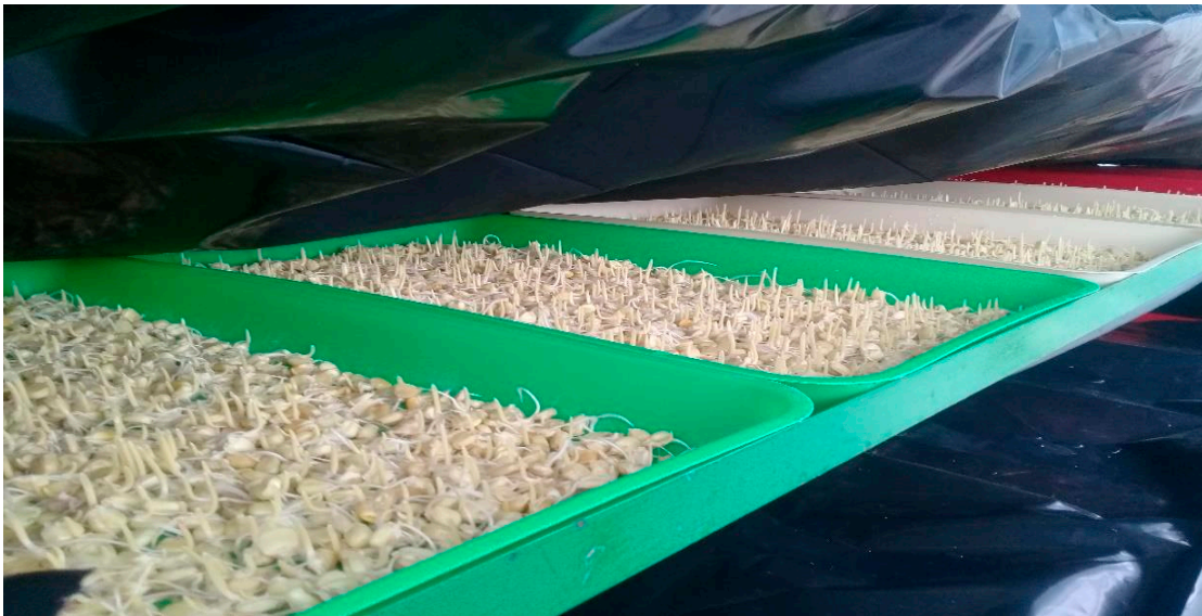
Siembra e inicio de germinación

Independientemente del tamaño de la bandeja utilizada, la densidad de siembra recomendada para maíz es de 2.5 a 3.6 kg/m 2 de semilla por bandeja, o sea que para una bandeja con dimensiones de 0.35 m de ancho por 0.55 m de largo (comunes en el mercado) se requiere de 0.45 a 0.68 kilos de semilla pre germinada. Para acelerar el crecimiento inicial es importante cubrir totalmente las bandejas con plástico negro por un período de 3 a 5 días.