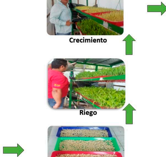
Flujo de establecimiento, manejo y suministro de FVH