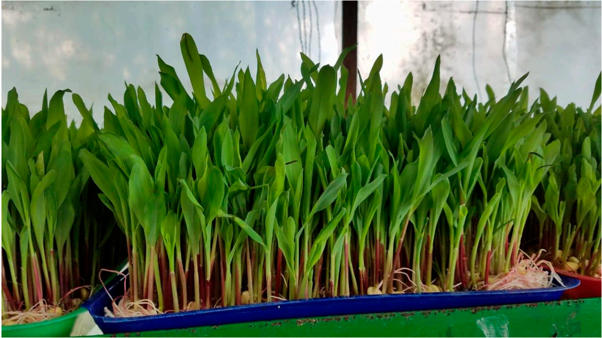
FVH listo para la cosecha

Otro aspecto indicador de que el forraje está óptimo para la cosecha es la formación de una colcha radicular bien definida de coloración blanca. Experiencias en los municipios de Teustepe y Camoapa en el departamento de Boaco, sobre producción de FVH a base de maíz presentan rendimientos entre 10 y 18 kg/m 2 con densidades de siembra de 2.5 a 3.6 kg/m 2 ; en la bandeja sugerida, equivale a utilizar 0.45 a 0.68 kg de semilla.