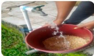
Pre-germinación (24 horas)