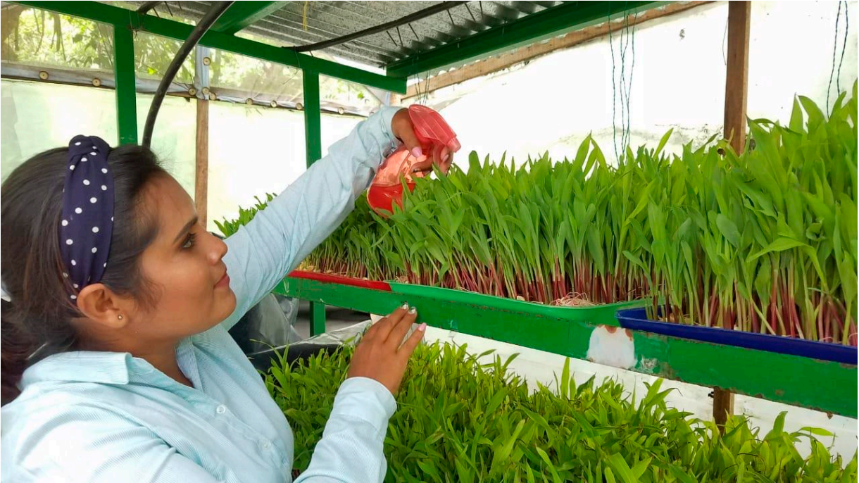
Aplicación de fertilizante orgánico foliar

removido cada tres días y para la obtención del producto final se filtra por medio de coladores de tela y nylon. Se almacena en recipientes plásticos de dos litros introducidos en una pila de agua.