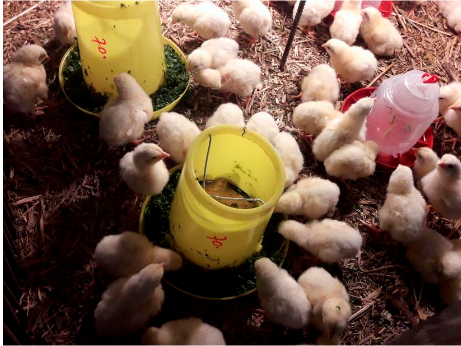
Pollos de segunda semana consumiendo FVH

Los pollos pueden consumir durante el ciclo productivo desde 13 hasta 35 kilos de FVH, en dependencia de la semana de inicio y de la inclusión utilizada (20, 30, 40 y 50%) con respecto al concentrado, con ganancias de peso en el día desde 40 hasta los 70 gramos por pollo.