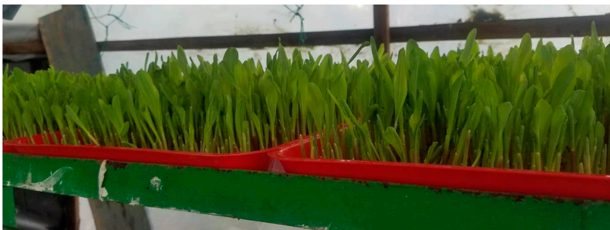
FVH de 5 días de germinación

Por lo anterior, se recomienda cubrir a cada extremo de la infraestructura con mallas de tela con orificios de 0.5 mm de diámetro. Esta práctica permite, además, prevenir enfermedades fungosas, caso contrario la excesiva ventilación puede provocar la desecación del ambiente y disminución de la producción por deshidratación del cultivo.