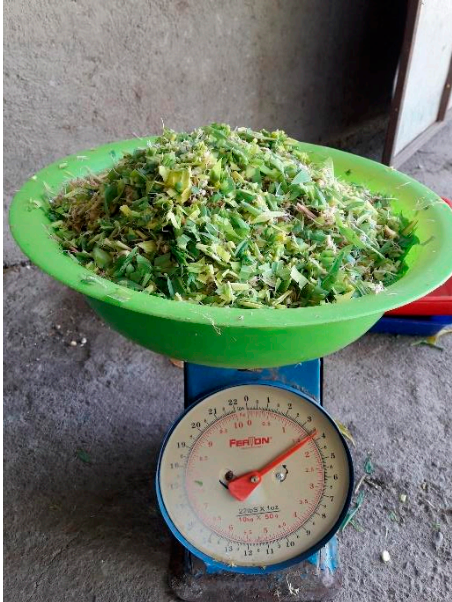
Mezcla de concentrado con FVH