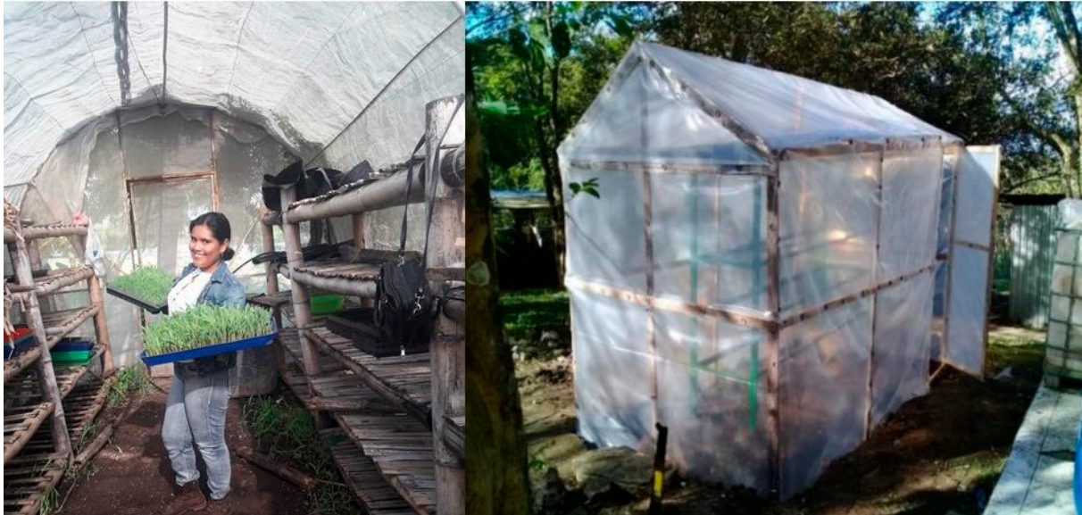
Cubierta para estantería