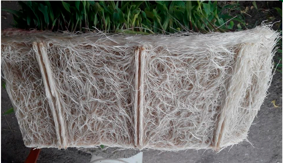
Colcha radicular característica de FVH

Para facilitar la recolección de la producción del FVH es recomendable que los tapetes de producción se enrollen y posteriormente desmenuzar o picar el forraje antes de proporcionarlo a los animales en sus comederos.