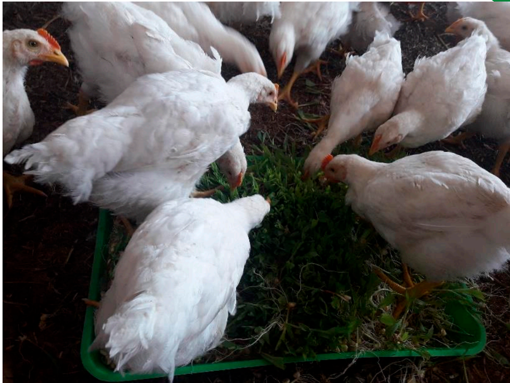
Pollos de sexta semana consumiendo FVH

Se debe mencionar que, aunque el pollo alimentado con FVH de maíz no presenta un peso final igual al del pollo alimentado 100% con concentrado comercial, pero si una mejor apariencia física (plumaje y color de sus extremidades y cresta); además, se ha podido constatar en los consumidores que presenta diferencias desde el punto de vista de la textura y el sabor, ya que es un alimento con mucha fibra y energía proporcionada por el FVH, razón por la que tiene una buena demanda en el mercado.