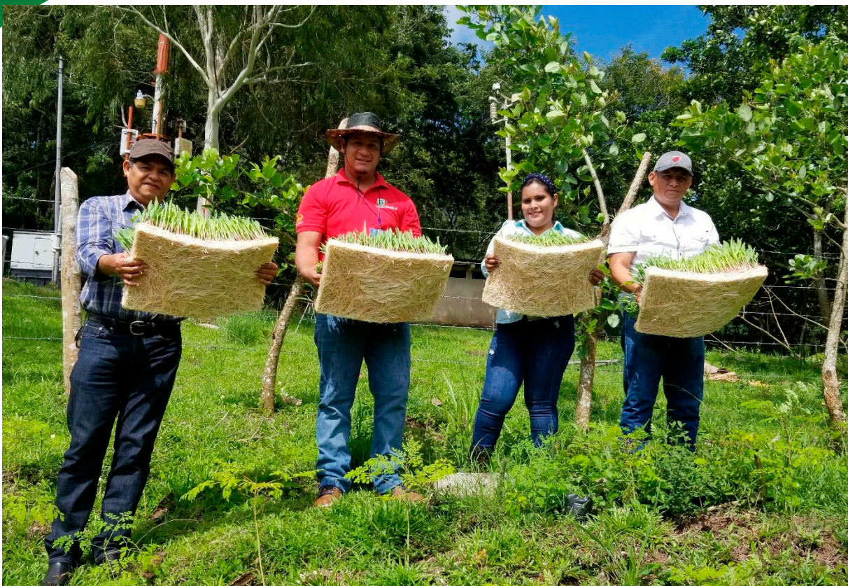
Colcha radicular lista para suministrar