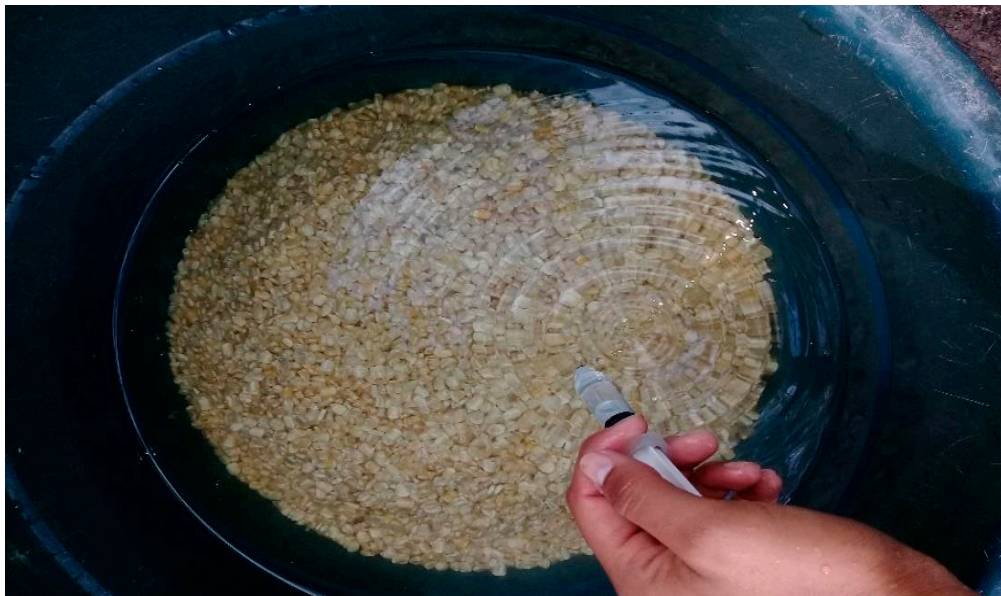
Lavado y desinfección de la semilla

La semilla se debe sumergir en agua durante un período no mayor a 10 minutos, utilizando 2mL de cloro por cada litro de agua, usando dos partes de agua por una de maíz. Este lavado permite prevenir los ataques de hongos y bacterias. Se lava la semilla y se cambia de recipiente. Por ejemplo: para 1 kg de maíz, se deben usar 2 litros de agua con 4 mL de cloro comercial.