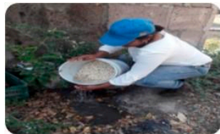
Selección y lavado De la semilla