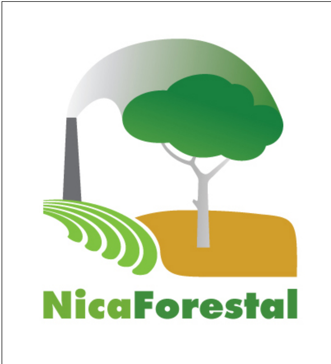
Figura 2. Logotipo de NicaForest, S. A