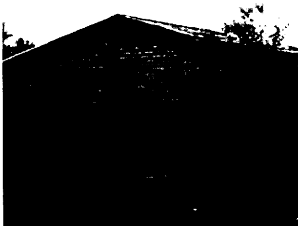
Figura 1. Casa de un campesino menos pobre

Campesinos menos pobres: categoría compuesta por el 15 % de las familias que relativamente tienen el más alto nivel de bienestar, puesto que tienen parcelas de 10 a 50 manzanas (mz), mejor infraestructura, cultivan hasta 10 mz de granos básicos, usan mayor cantidad de insumos externos, crían hasta 20 cabezas ganadas y pueden contratar mano de obra temporal. Sus ingresos pueden superar los C$ 30 000 anualmente y provienen de la venta de maíz, frijol y productos lácteos; estos son suficientes para satis-