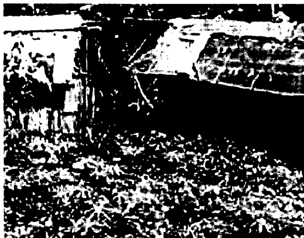
Figura 3. Casa de un campesino muy pobre.

Campesinos(as) muy pobres: está compuesto por el 38 % de las familias con el más bajo nivel de bienestar por su condición de extrema pobreza. Carecen o tienen poco acceso al medio de producción fundamentales que es la tierra, por lo que recurren a establecer arreglos con familiares para tener derecho a utilizar un lote de terreno a cambio de su fuerza de trabajo, a la migración temporal y/o la venta de fuerza de trabajo como jornaleros para obtener el sustento familiar. Todo esto los vuelve altamente vulnerables y dependientes de factores externos.