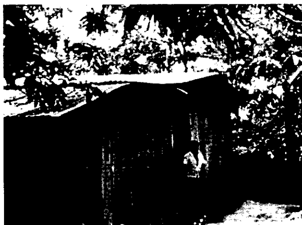
Figura 2. Casa de un campesino pobre

Campesinos(as) pobres: abarca el 46 % de familias que a pesar que cuentan con parcelas de 5 a 15 mz tienen un bajo nivel de bienestar; se caracterizan por poseer poca infraestructura (generalmente en regular o mal estado), cultivar de 2 a 4 mz de granos básicos y de 0.5 a 2 mz de café; utilizar mano de obra familiar y/o practicar la mano vuelta. Llegan a obtener ingresos de hasta C$ 10 000 anualmente, que satisfacer en parte las necesidades básicas de sus hogares.