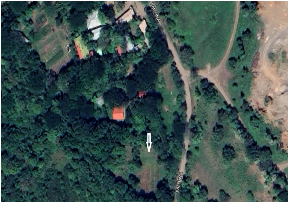
Figura 1. Universidad Nacional Agraria sede juigalpa-Chontales.

La investigación se llevó a cabo en el campo experimental de la universidad nacional agraria, en la ciudad de Juigalpa chontales, esta constituye un área aproximada de 0.77 ha, teniendo las siguientes coordenadas X (679203) Y (1336804) ubicada a 70 Msnm.