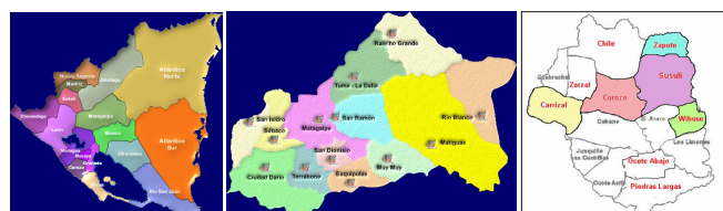
Figura 1. Área de estudio.

fecha en estudio y 2º haber participado en acciones definidas en los planes anuales del componente productivo. La muestra realizada corresponde al 15.8% de la población total (550 beneficiarios del proyecto con el componente productivo). La cual corresponde a 87 productores. También se entrevistaron: un técnico agrónomo y 4 representantes de organizaciones. Para un total de 92 entrevistados. Se analizaron las siguientes variables de estudios; Capacitación y Asistencia técnica, Ingresos productivos, uso y manejo de los desechos orgánicos, y lecciones aprendidas. En el análisis de información en los cuadros de salida y en los cuadros consolidados, se empleó datos de frecuencia y porcentajes por cada variable y por cada actor social.